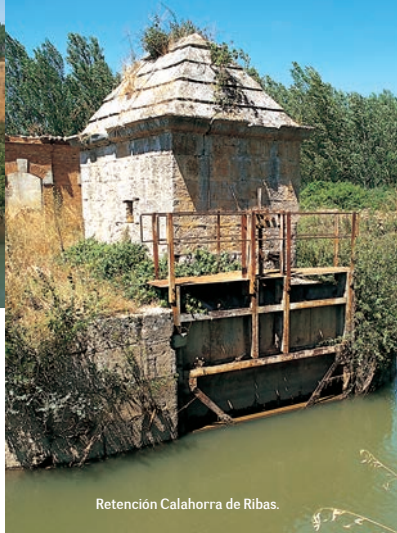
Retención Calahorra de Ribas.