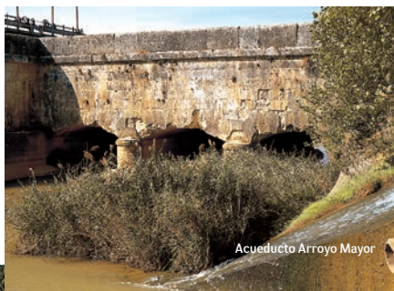
Acueducto Arroyo Mayor

Desde ambas localidades el sendero GR89 nos indica como retornar al Canal.