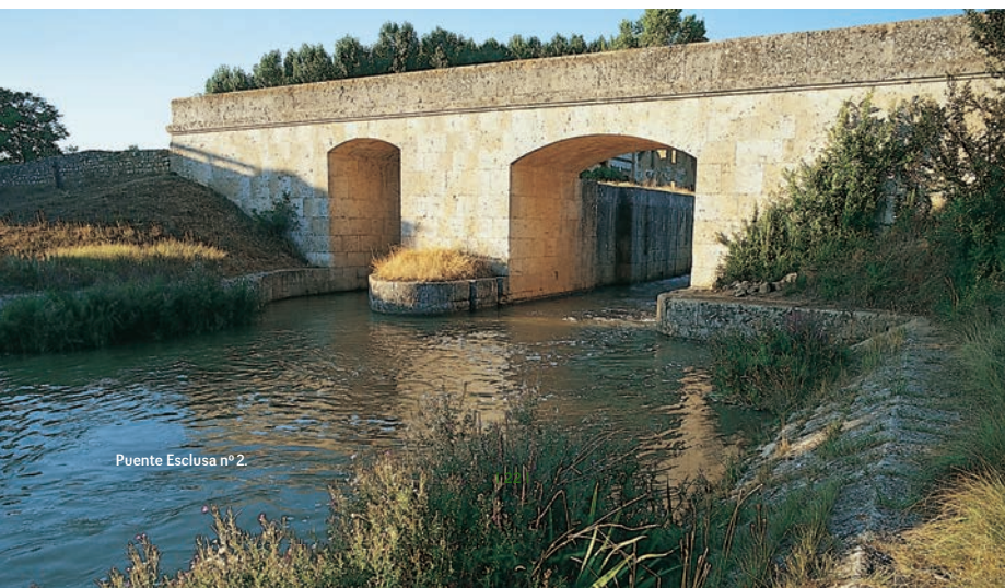
Puente Esclusa nº 2.

Continuamos nuestro camino y veremos unas compuertas sobre el Canal, justo en el acueducto de tres ojos, sobre las aguas del río Retortillo. Aquí el Canal aumenta generosamente las aguas del río que, un poco más abajo, inundarán la Laguna de la Nava. Este humedal, junto al de Villafáfila (Zamora), es de los más importantes de la Tierra de Campos.