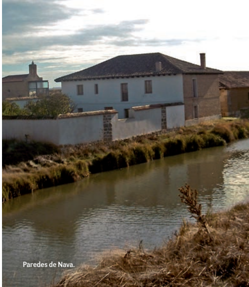
Paredes de Nava.

Volveremos para retomar nuestra ruta, continuando por el margen izquierdo. A 5 km, otro acueducto, esta vez sobre el río Valdeginate. Estamos en Abarca de Campos. Si nos hemos fijado llevamos 2 etapas (casi 50 km) sin haber encontrado ninguna esclusa. Ahora podemos ver la primera de este Ramal. Se encuentra en el "Barrio del Canal" de la localidad de Abarca de Campos, junto a otras edificaciones típicas como la Fábrica de Harinas, que estuvo funcionando como Centro de Arte Contem-