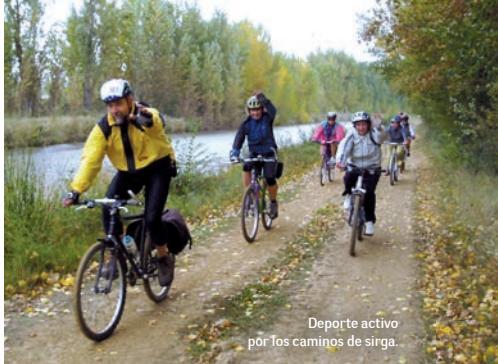
Deporte activo por los caminos de sirga.

Y llegamos a la Dársena de Medina de Rioseco, la más grande de las que existen en el Canal. Su fábrica de harinas, visitable, y sus almace-