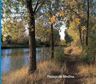
Paisaje de Medina.

Continuando nuestro recorrido por el Canal de Castilla, volvemos al puente de la antigua carretera de Castromocho a Villarramiel, tomamos el margen derecho y caminamos por sendas solitarias con la sola compañía de los pájaros.