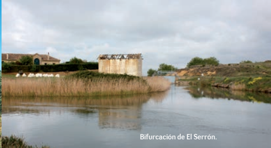
Bifurcación de El Serrón.

Una vez que hemos cruzado la carretera que atraviesa el Canal, continuaremos el curso del agua por el margen izquierdo. Siete kilómetros más abajo llegaremos al Serrón, lugar donde el Canal se ramifica: el Ramal Campos continúa su cauce por el ramal de la derecha