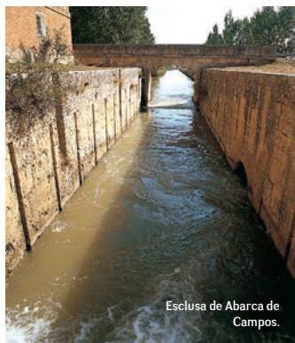
Esclusa de Abarca de Campos.

Desde Paredes de Nava nos dirigimos al lugar conocido como Sahagún el Real, una de las poblaciones que surgieron con el Canal.