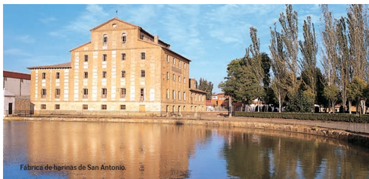
Fábrica de harinas de San Antonio.

nes, convertidos en albergue turístico, Centro de Recepción de Viajeros del Canal y de diversas actividades turísticas, funciona durante todo el año de martes a domingo (para más información y reservas, el teléfono es: 983 701 923).