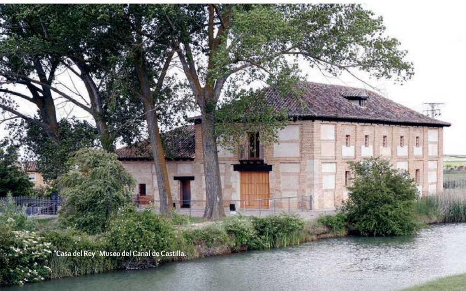
"Casa del Rey" Museo del Canal de Castilla.

El puente de Valdemudo fue el primero en construirse, para permitir el paso de la Cañada Real Leonesa. Con el fin de no obstaculizar el paso del ganado se construye este puente funcional, perfecto y armonioso, fabricado sobre el suelo, ahorrando de esta manera las cimbras. Después ha sido utilizado para el paso de la carretera de Palencia a Carrión, en la actualidad se encuentra fuera de uso.