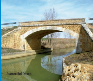
Puente del Deseo.

Desde Paredes de Nava nos dirigimos al lugar conocido como Sahagún el Real, una de las poblaciones que surgieron con el Canal.