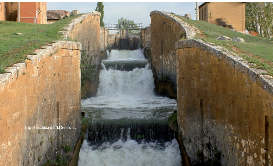
Triple esclusa de "El Serrón".

Las esclusas 31 y 32 están en Viñalta. Desde aquí, por el lado izquierdo del Canal, un ramalillo llega hasta la ciudad de Palencia, concretamente a la "Dársena de Palencia", que tuvo su importancia en el transporte, en la época de apogeo de la navegación por el Canal. El Canal discurre, entre el Monte el Viejo y el río Carrión, hasta Villamuriel de