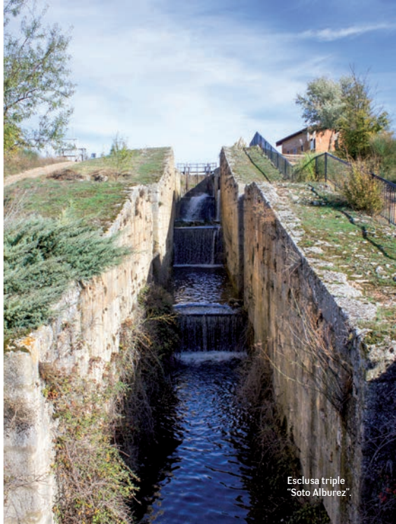
Esclusa triple "Soto Alburez".

Reanudamos la ruta, continuando por el margen izquierdo. Nos quedan aún 6 km para acabar la etapa, pero antes pasaremos por otras dos esclusas, esta vez simples, la nº 37 y la nº 38, ambas en el término municipal de Dueñas, otra localidad canaliega declarada "Conjunto Histórico Artístico" en 1967, visita obligada y fin de esta etapa.