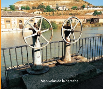
Manivelas de la dársena.