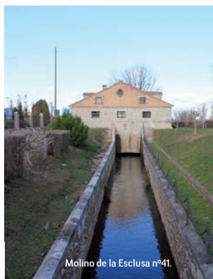
Molino de la Esclusa nº41.

Continuamos el recorrido después de nuestro descanso en Dueñas. Es la última etapa del Ramal Sur y la más transitada, por su proximidad a las dos capitales de provincia (Palencia y Valladolid)