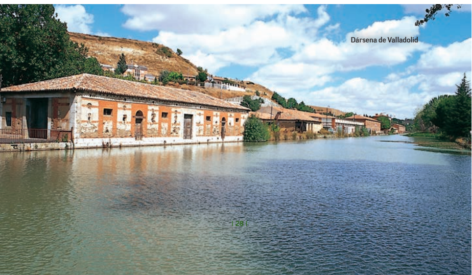
Dársena de Valladolid

Al incorporarnos al Canal en Dueñas, lo haremos por su margen derecho. Entre el bullicio de las idas y venidas de los vehículos y los trenes, podemos disfrutar del atractivo de las esclusas y bonitos puentes que nos encontraremos en el recorrido, puentes que, a su vez, nos dan la posibilidad de acercarnos a las localidades canaliegas. Así por ejemplo, a casi 8 km. del inicio de ruta, nos encontramos con la esclusa 39 y el puen-