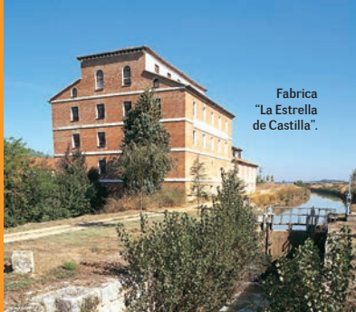
Fabrica "La Estrella de Castilla".