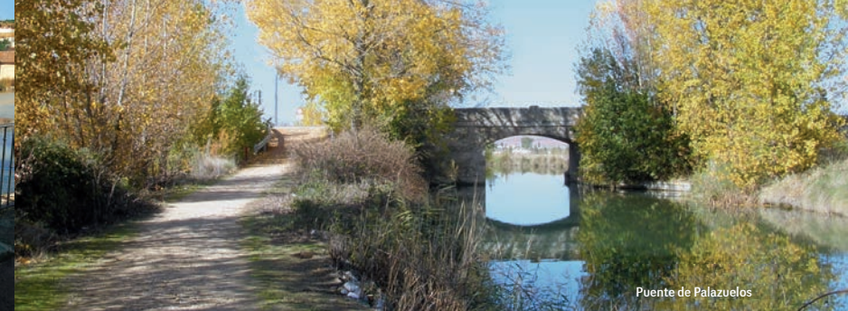
Puente de Palazuelos

te que nos lleva a Trigueros del Valle, Cubillas de Santa Marta y Valoria la Buena. El río Pisuerga y el Canal van casi paralelos, por lo que se pueden ver sotos y parajes donde abundan todo tipo de aves y flora.